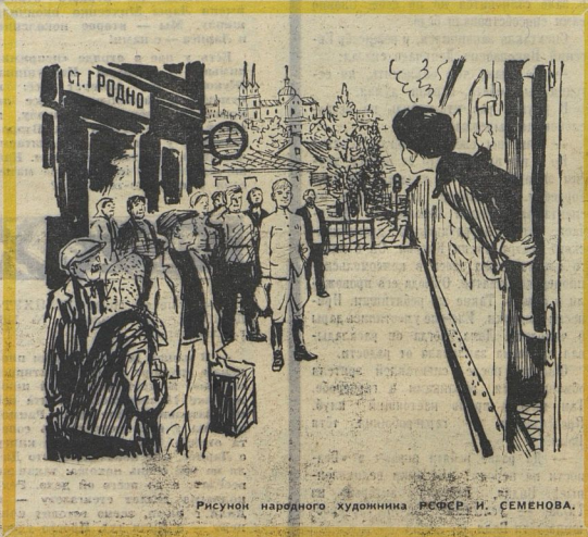
Рисунки народного художника ЯСОНА И. СЕМЕНОВА.

ми. Нашёлся на её голову новоявленный Милуха-Магдан.